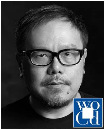
刘小康 靳刘高设计 创办人

刘小康是一位香港设计师，以其艺术和创新设计而闻名，是香港多个最具标志性设计的幕后功臣，代表作品包括为他赢得多个奖项的屈臣氏蒸馏水水樽设计；当中的设计美学及功能设计被誉为瓶装水史上的重大突破。此外，刘小康更一直孜孜不倦地推动香港、大中华区及亚洲的设计发展。