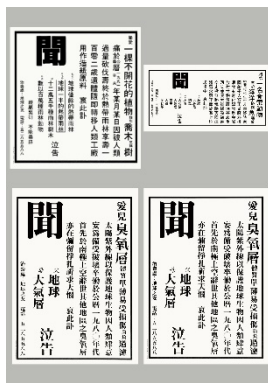
Company: 至威湯遜(香港)廣告公司 Designer: Stanley Wong / Raymond Chan/ Paul Regan /

自七十年代初期，香港政府新聞處為推廣清潔香港運動而設計一系列的海報，這一張由許敬雅先生設計的 1975 年清潔年海報，正因 1975 年是中國兔年，所以畫面由一隻白色小白兔打敗垃圾蟲為主視覺，主色調亦為清潔香港的紫色和黃色，設計者很聰明地運用紙張的白色而造成畫面有三種顏色。