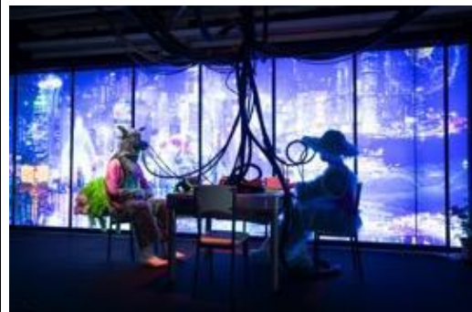
打卡熱點 - 「數碼龐克號」內的「麻雀房」