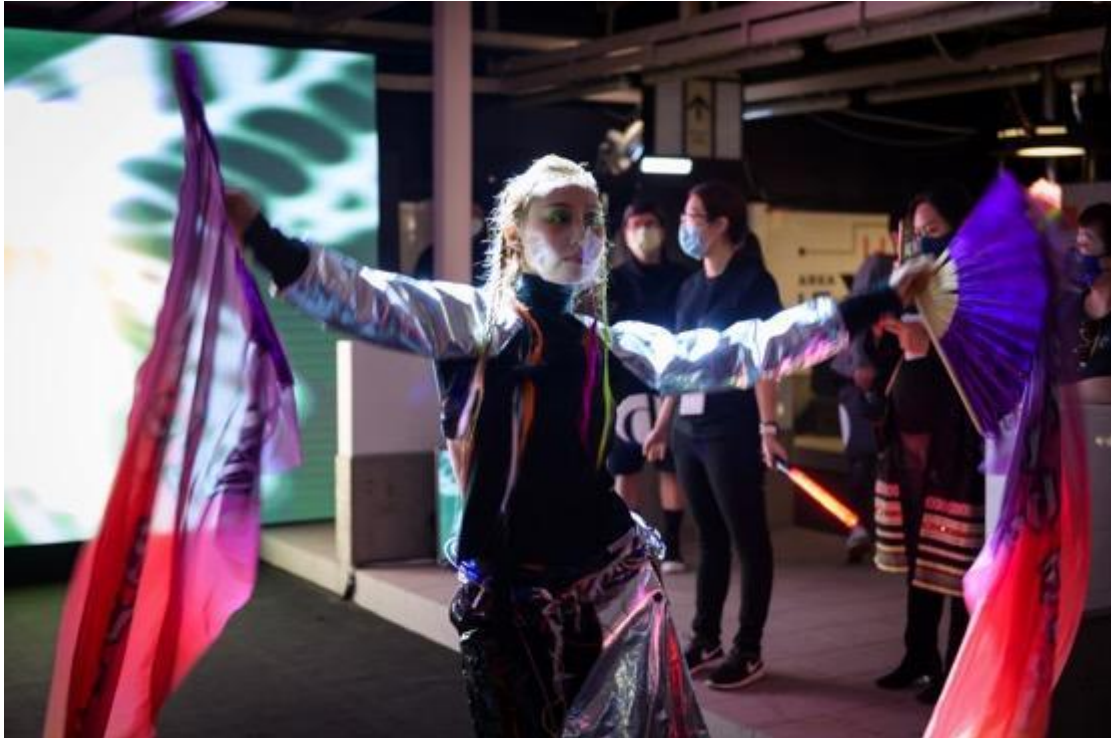
圖片說明：創意時尚體驗「數碼龐克號」主場地

創意時尚體驗「數碼龐克號」正式啟航 親臨深水埗進入超現實科幻世界 體驗霓虹燈下的時裝幻影