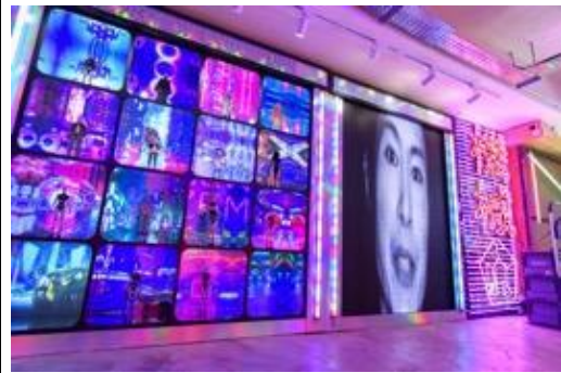
作為「數碼龐克號」的展覽店，「合舍」將變身為機械人改造工場，同場亦將展示 10 款限量版立體人物模型，讓你發現時裝的另一種展現模式