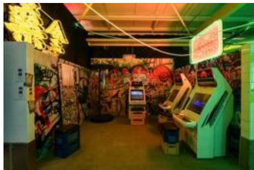
打卡熱點 - 「數碼龐克號」內的遊戲室，街機在未來世界仍然大受歡迎