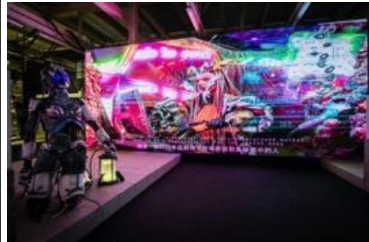
打卡熱點 - 「數碼龐克號」半人半機械的電影場景裝置，位於通州街臨時街市的打卡熱點被超凡生物人工智能載體「Mother Brain」喚醒