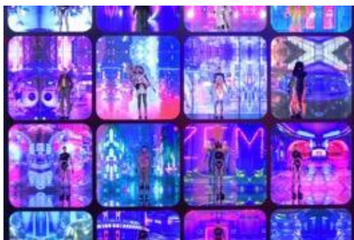
「數碼龐克號」10 款限量版立體人物模型人造人 Zero，穿著 10 組時裝及配飾設計師的服飾