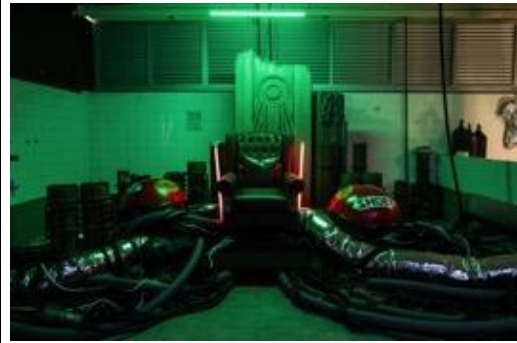
打卡熱點 - 「數碼龐克號」內可供上座的裝置，一個數碼龐克迷必定熟識的電影場景