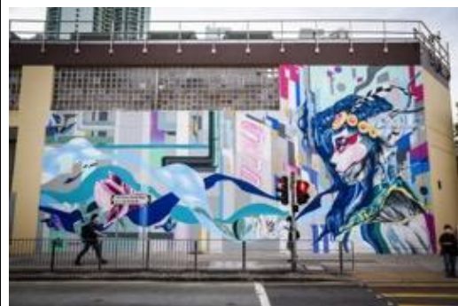
由 HKWALLS 創作「數碼龐克號」大型戶外壁畫- 畫家 TAKA