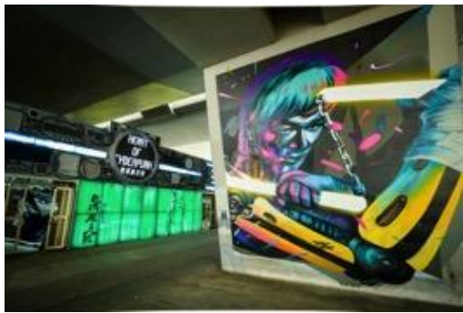
「數碼龐克號」總部入口