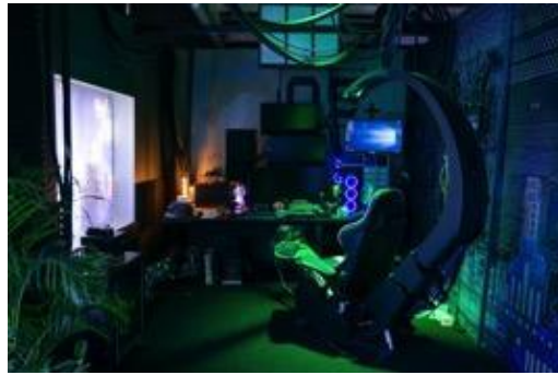
打卡熱點 - 「數碼龐克號」內的科幻工作室，可一窺未來世界黑客宅男眼中所見的影像