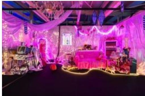
打卡熱點 - 「數碼龐克號」時代既夢幻且科幻的少女房間