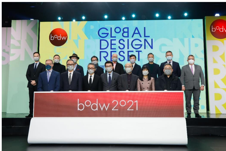
一众主礼嘉宾出席设计营商周2021开幕典礼

参与“环球设计 创意重启”大型对话：超过 30 场网上实时直播论坛讲座，涵盖多元切身主题包括“品牌活化”、“款客旅游新思维”以及“幸福未来”