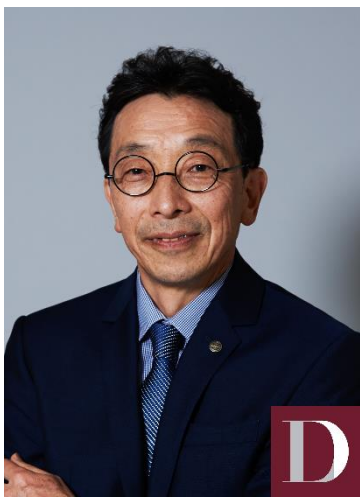
伊部菊雄 CASIO 计算机株式会社 時計事业部高级研究员

伊部菊雄，被誉为「G-SHOCK 之父」，于 1981 年成功研发并商业化防震手表 G-SHOCK，彻底革新了腕表行业。G-SHOCK 凭借其突破性的创新，成为耐用与时尚的象征，即使遭受撞击或跌落仍能完美运作。