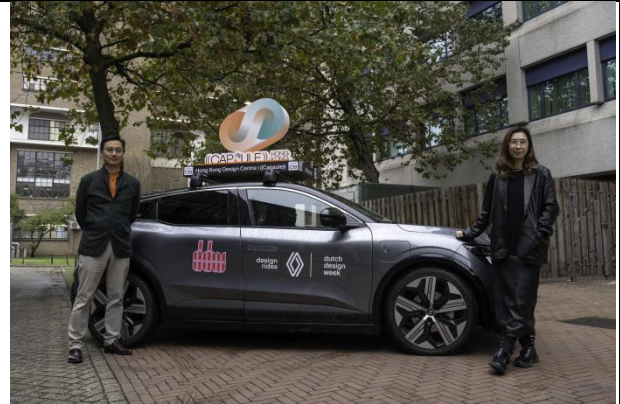
当地出租车化身为「『香港设计((囊))'Design Rides」，以夺目有趣的方式与观众互动。