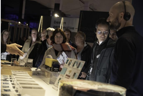
「香港设计((囊))」展览现场不乏参观者。