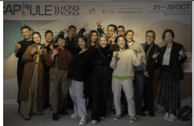
一众香港设计师及「香港设计((囊))」展览的香港设计中心策展团队在会场合照。