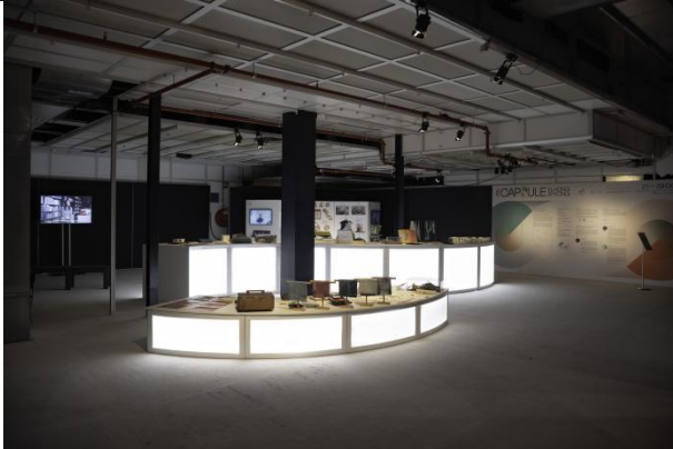
「香港设计((囊))」展览现场，回旋形的展场设计呼应「循环」和「无限」两个策展概念。