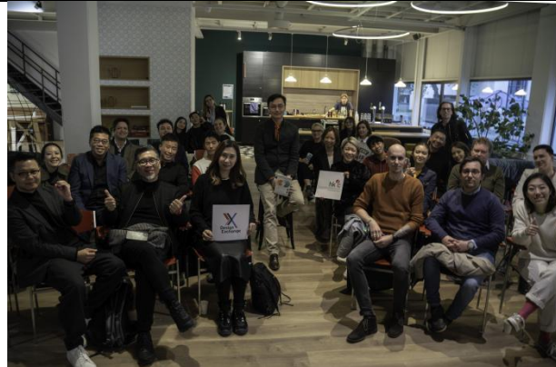
dX 设计对谈，通过主题式讨论，香港与荷兰两地交流和业界互动。