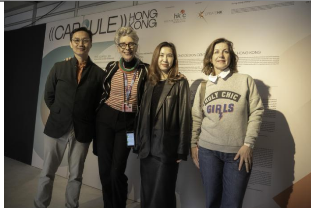
香港设计中心两位策展人与来自 CreativeNL 及荷兰政府的代表合照。