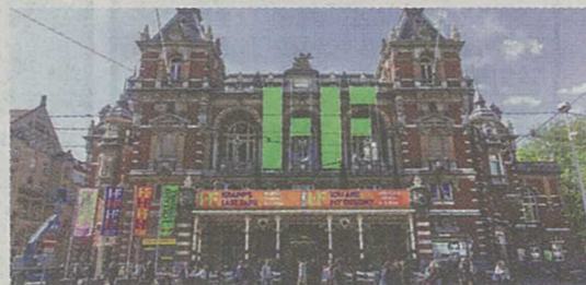
■Simpson在荷蘭thonik參與完成的項目。(圖由Thijs de Lange提供)

Simpson強調荷蘭設計畢業展作品的水平很高，當地畢業生可獲得政府資助，以推行概念性和研究性的計劃，他們懂得運用創新思維去表達，讓Simpson留下深刻印象。回港後，Simpson表示會繼續發展他的設計領域，同時結合寫作、研究和教育等多方面發展。現時正設計一本書，以及一個研究中國創意工業的荷蘭學術網站，發揮在荷蘭實習的優勢。