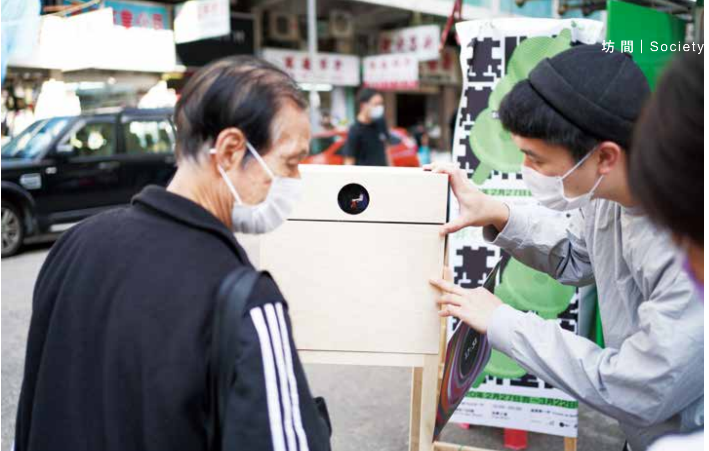
▲ 定格基隆街日常生活場景的幻燈機互動裝置快閃街頭時，引來不少好奇街坊