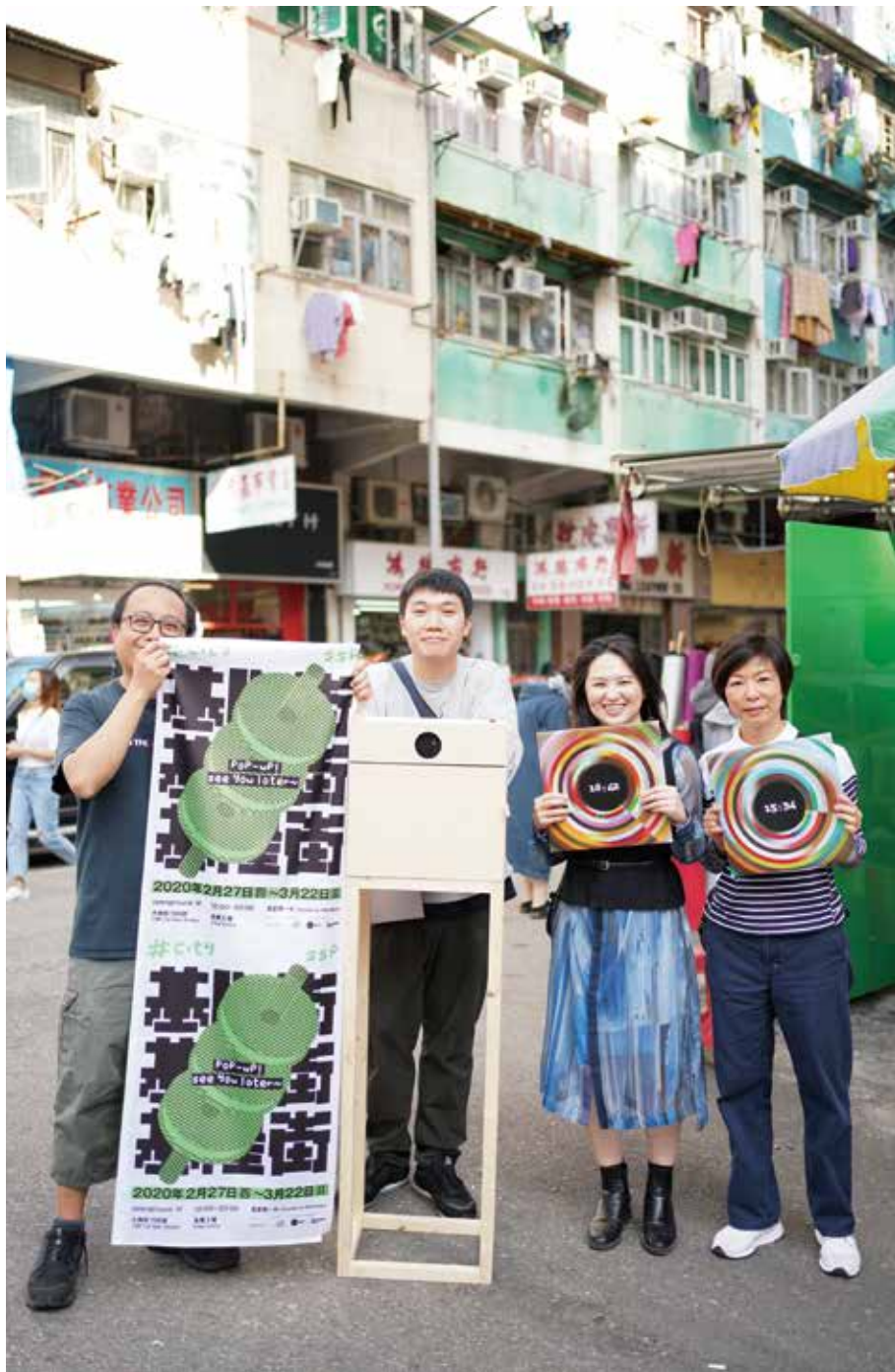
▲ 深水埗復合設計空間openground組織策劃的「#CITY」展以創新視角探尋社區前生今世，並透過街頭快閃互動展示，強化社區連接，是2019「BODW城區活動」公眾教育項目之一

我上上代就是住深水埗，（父母）兩邊的上一代都住這裏，我小時候基本上每個周末都會在這邊，生病的時候也會在這邊，因為爸爸媽媽要工作嘛。這個區最特別的地方就是，每一個做藝術、做設計的人可能都離不開，全香港這裏最容易找到各種原材料，很