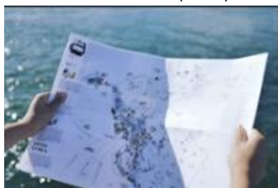
島民有限公司(香港)