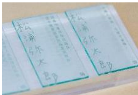
STOREROOMS/ COMING-SOON (日本、香港)

LOFFI. 單車手套擁抱的使命：讓每個人的旅程更愉快。不論手套的手背或掌心，標誌性的笑臉設計鼓勵道路上的正面互動。除了用家，其他道路使用者看到也會會心微笑，馬路上輕鬆無煩燥，此款手套 2.0 適合成人單車駕駛者使用，全年均可穿戴，並集舒適、款式及功能性於一身。最重要的當然是充滿玩味！