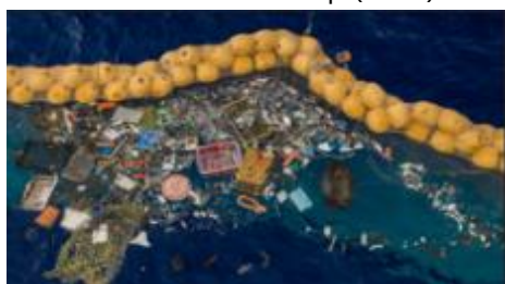
The Ocean Cleanup (荷蘭)