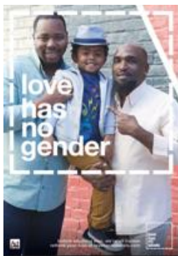
AD Council (美國)