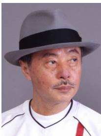
淺葉克己 淺葉克己設計工作室 創辦人

淺葉克己生於1940年，現居東京，是一位藝術總監、書法大師。他對亞洲豐富的文字文化遺產及探索文字和視覺表達之間的關係尤感興趣。