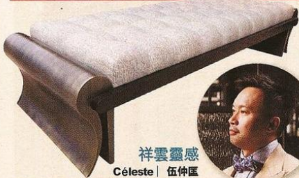
祥雲靈感 Céleste | 伍仲匡

滿城熱話都圍繞著《香港巴塞爾藝術展2013》的同時，香港設計中心亦於同期邀請了本地9位著名設計師，以「椅」為題，展示不同風格的設計，部分更是得獎之作，如果你錯過了是次展覽，便可以透過以下介紹，窺探本地的設計視野。