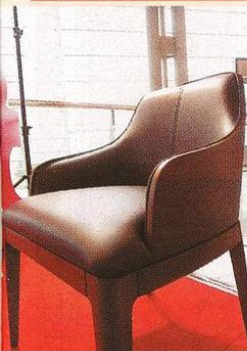
圓弧設計 LUXE | 梁志天

著名建築及室內設計師梁志天，推出的傢具系列「LUXE」，靈感源自名貴跑車的內飾，以及遊歷的室內設計，以簡潔的直線條加上圓弧勾勒出家具的基座，選用名牌真皮和上乘木料。設計師透過流暢的線條與優美的圓弧設計，突出獨特而高貴的外形。