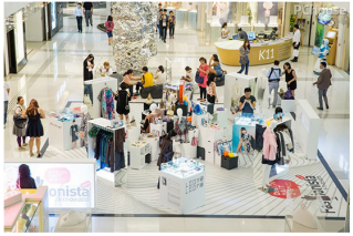
活动现场人流不断

以「Fashionista Hong Kong」为主题的Design Mart 2015，今年接待许多才华横溢的时装和配饰设计师等独立申请，于物色过去的历程，42个售卖配饰、服装、首饰及装饰品的设计单位于K11 K11，将创意理念落地，向公众推广及展销他们的产品，而40位来自「设计创业培育计划」之年轻设计师则进驻了中庭，展示各具特色的货品，是次活动约有12万人次，总营业额突破港币51万元。